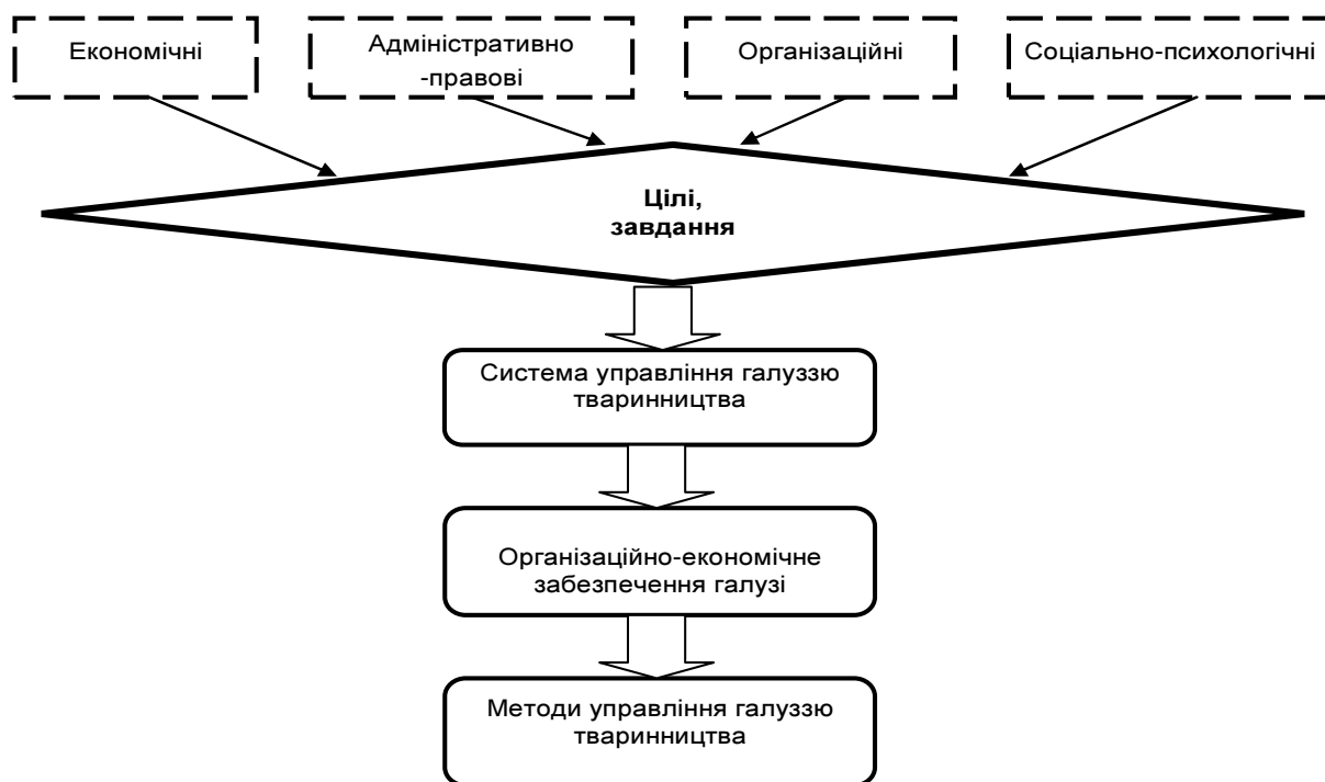
Рис. 3. Система управління галуззю тваринництва

На основі такої структурованості можна побудувати як загальну схему організаційно-економічного забезпечення управління галуззю, так і запропонувати його варіанти залежно від переважання складових структури. Організаційно-економічне забезпечення управління галуззю – це сукупність економічних, адміністративних, правових, організаційних методів впливу на об'єкт управління – тваринництва. На рис. 3 відображені взаємозв'язки системи управління з організаційно-економічним забезпеченням управління.