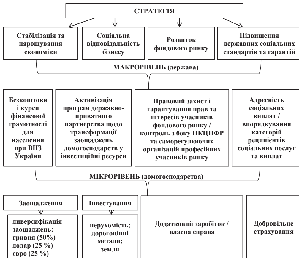
Рис. 2. Стратегія вдосконалення фінансів домогосподарств в Україні

в частині заробітної плати є співставними із зарубіжними, однак щодо самозайнятості та підприємницької діяльності спостерігається невідповідність (4–6% проти 10–18%).