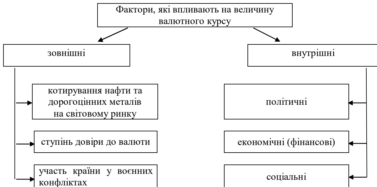
Рисунок 1. Фактори впливу на величину валютного курсу.*

На величину валютного курсу впливають як зовнішні, так і внутрішні фактори (див.рис.1).