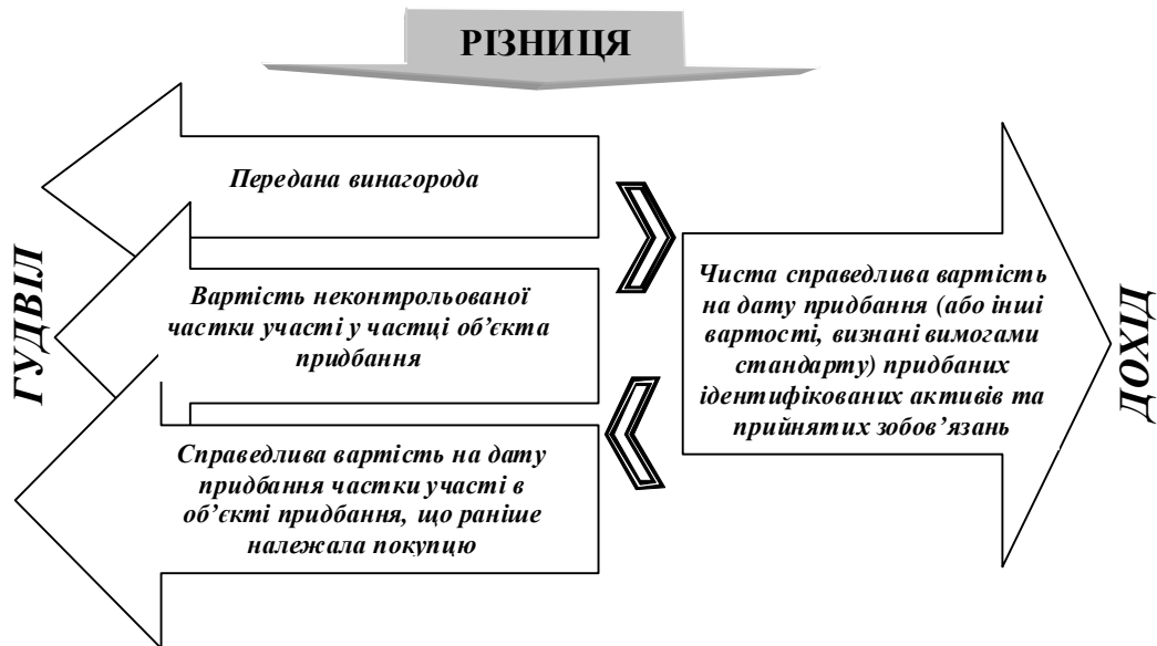
Рис. 1. Схема визначення гудвілу внаслідок об'єднання підприємств