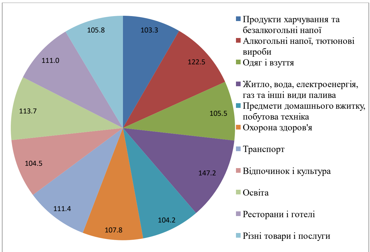
Рис. 1. Індекс споживчих цін на товари і послуги у 2016 р., %

категорії алкогольних напоїв та тютюнових виробів – 12,5%. І наступну позицію займає освіта – 113,7%.