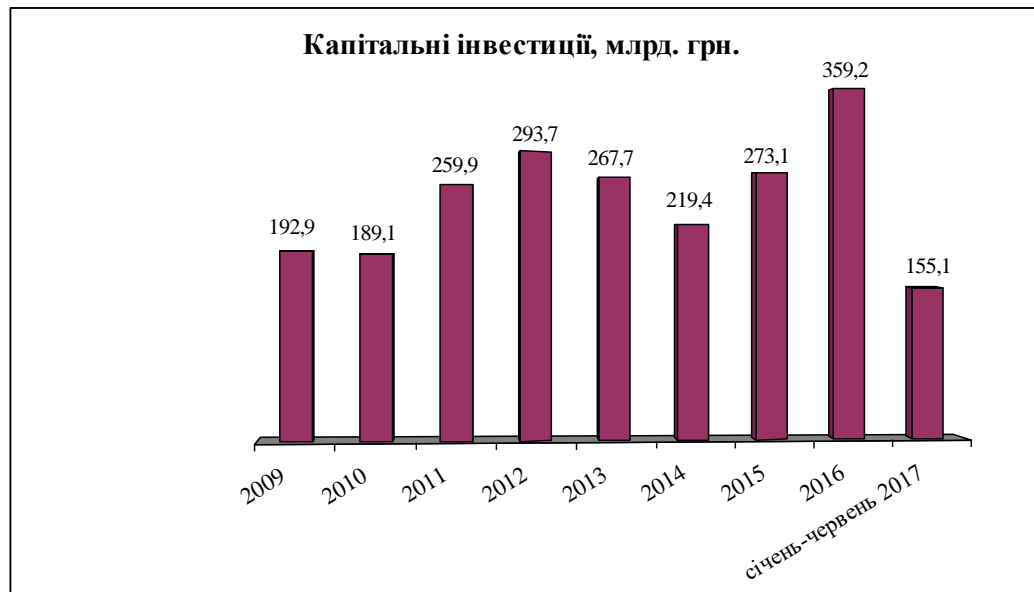
Рис. 2.3. Капітальні інвестиції, млрд.грн., 2010-2017 рр.

Обсяги освоєння капітальних інвестицій підприємств України у січні-червні 2017 року складають 155,1 млрд. грн., що на 22,5 % більше від обсягу капітальних інвестицій за відповідний період 2016 року.