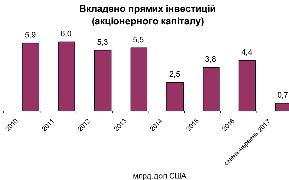
Рис. 2.1. Прямі інвестиції, 2010-2017 рр.[11]

Обсяг залучених з початку інвестування прямих іноземних інвестицій (акціонерного капіталу) в економіку України на 01.07.2017 року становив 38981,5 млн.дол. США*.