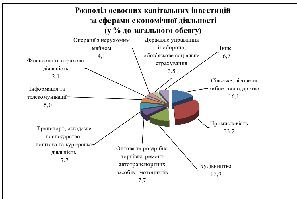
Рис. 2.4. Розподіл освоєних капітальних інвестицій за сферами економічної діяльності, 1 півріччя 2017 р. [18]

Головним джерелом фінансування капітальних інвестицій, як і раніше, залишаються власні кошти підприємств та організацій, за рахунок яких у січні-червні 2017 року освоєно 74,3 відсотка капіталовкладень.