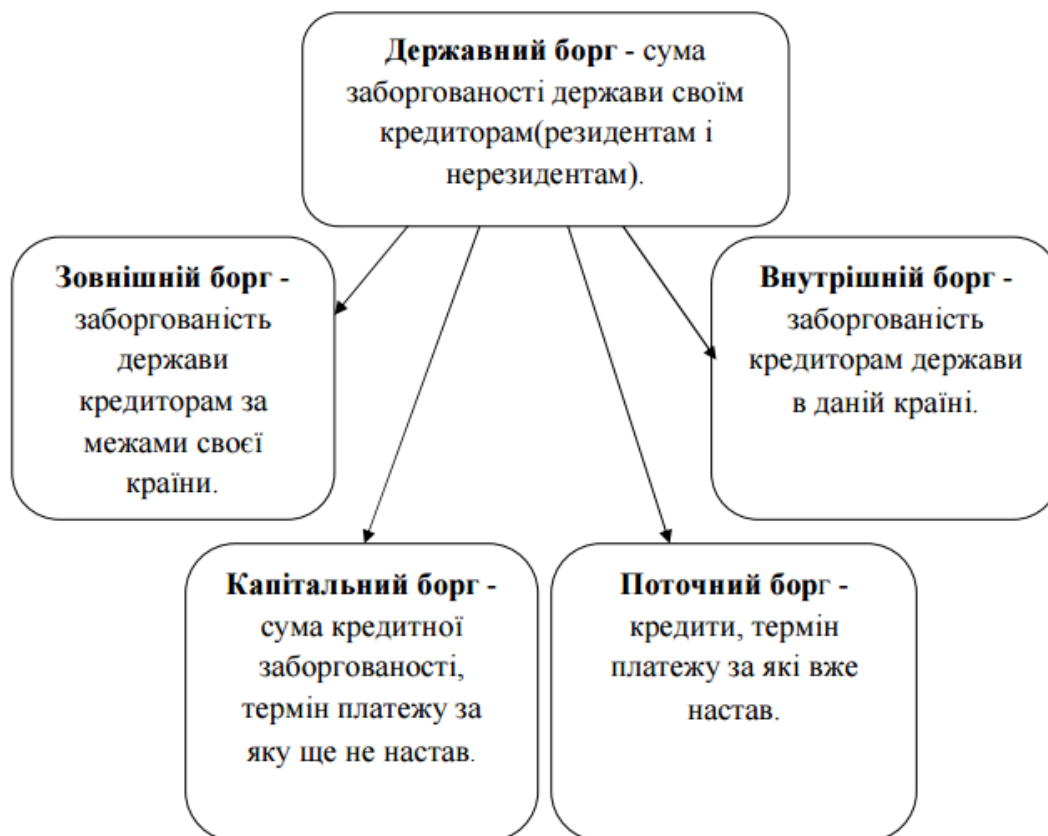
Рис.1 Структура державного боргу

Державний борг – це певна сума, яку держава запозичила в зовнішніх кредиторів, а також це сума, яка дорівнює непогашеним державним позикам.