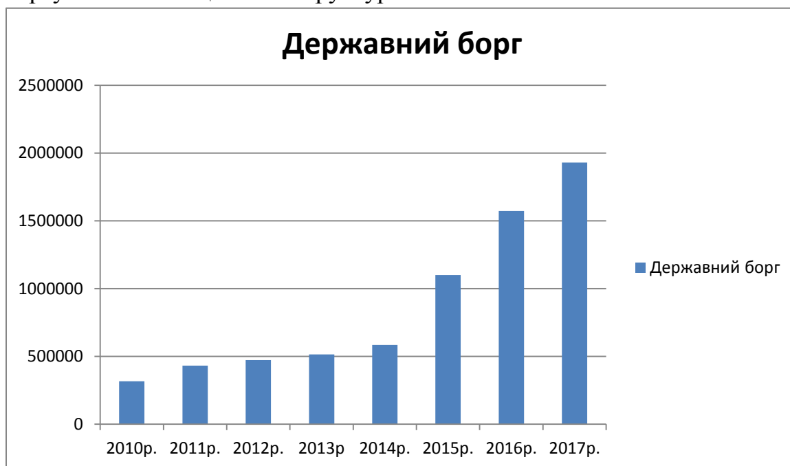
Рис.1.2. Динаміка державного боргу

Протягом декількох останніх років обсяг державного боргу України динамічно зростає. (рис 2,1). За даною діаграмою ми спостерігаємо щорічне збільшення суми державних запозичень. На 1 липня 2017р. сума державного боргу складає 1929759 млрд. грн.. Це загрожує національній економіці в майбутньому. Це може призвести до дефолту. У даному контексті важливими завданнями даної ваги є не лише постійний моніторинг загального обсягу державного боргу України з метою недопущення його збільшення понад безпечну межу, а й пильне спостереження за динамікою складових державного боргу та оптимізація його структури.