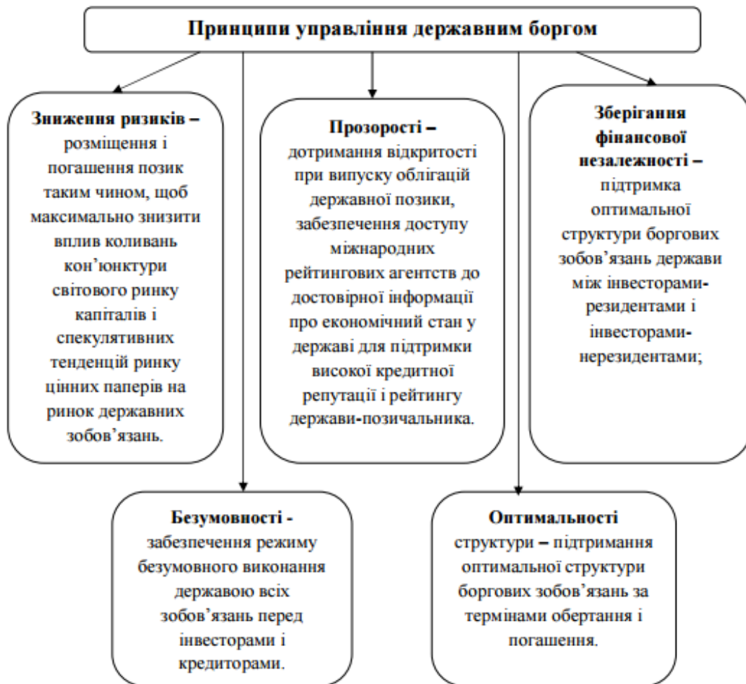
Рис.2. Принципи управління державним боргом

Для того, щоб ефективно керувати залученими коштами потрібно дотримуватись деяких принципів. (рис.2)