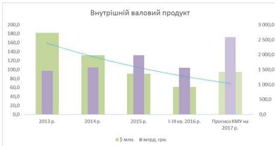
Рис. 2.1. ВВП 2013-2017 рр. [13]

прогнозований КМУ (Постанова № 399 від 01.07.2016) обсяг номінального ВВП, приведений до прогнозованого НБУ курсу долара, становить $ 94,0 млрд – це на 93,72 % менше від показника 2013 року.