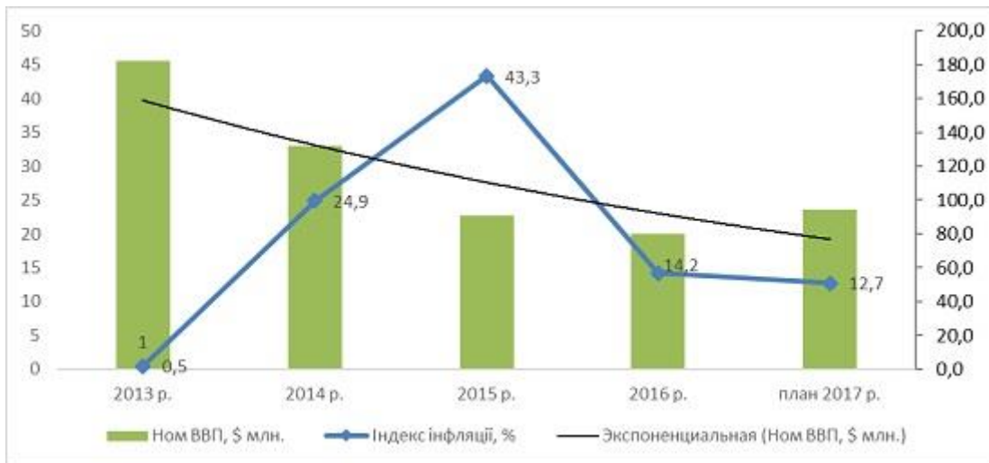
Рис. 2.4. Номінальний ВВП та Індекс інфляції, 2013-2017 рр.