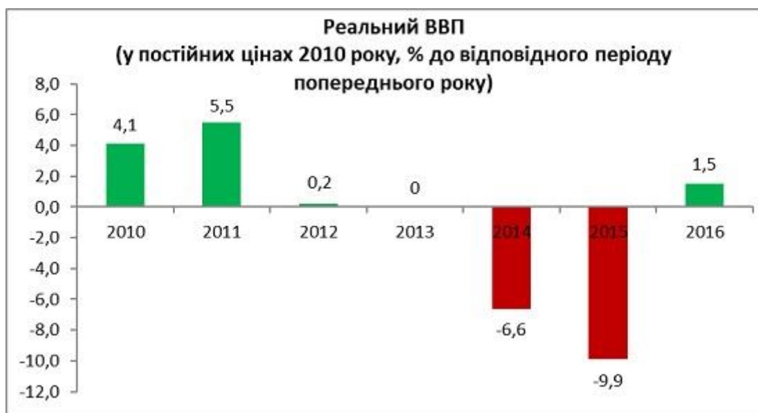
Рис. 2.2. Реальний ВВП 2010-2016 рр. [17]

Тобто, аналіз динаміки реального ВВП чітко показує на рецесійні процеси української економіки, а саме падіння виробництва. Навіть ріст реального ВВП на 1,5 % у 2016 році є негативним результатом, оскільки відповідний ріст вираховується у відношенні до попереднього року та, як вбачається з графіка, стрімке падіння реального ВВП протягом 2014–2015 років підтверджує лише те, що економіка країни повернулася до рівня 2000-х років.