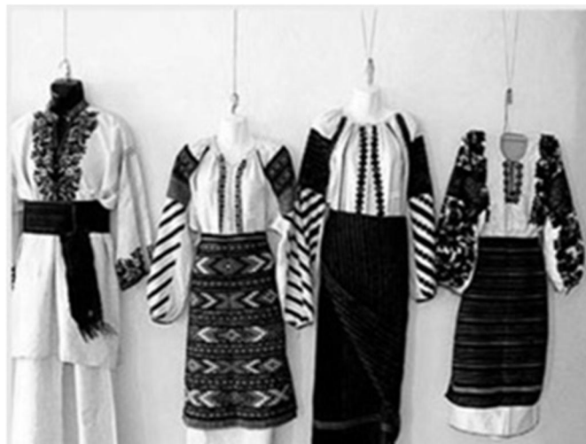
Рис. 2.5. Борщівська «чорна» сорочка [5].