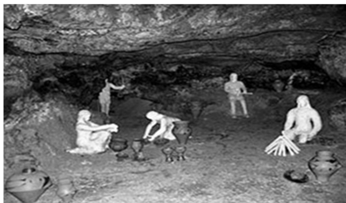
Рис. 2.6. Печера Вертеба. Реконструкція стоянки древніх людей[5].

Музей трипільської культури в печері «Вертеба» – музей трипільської культури, що розташований в однойменній печері, яка розташована за 2 км на північний захід від села Більче-Золоте. Був створений 5 жовтня 2004 р. в печері «Вертеба» створено перший в Україні підземний музей трипільської культури. Печера Вертеба є особливою серед гіпсових печер Поділля. Вона дещо відрізняється від інших своєю геологічною будовою, а також тим, що в ній виявлено величезне багатство археологічних знахідок доби енеоліту (IV-III тис. до н.е.). Загальна протяжність підземних ходів печери Вертеба становить 8 км. Перша задокументована згадка про археологічне обстеження печери відноситься до початку XIX ст.