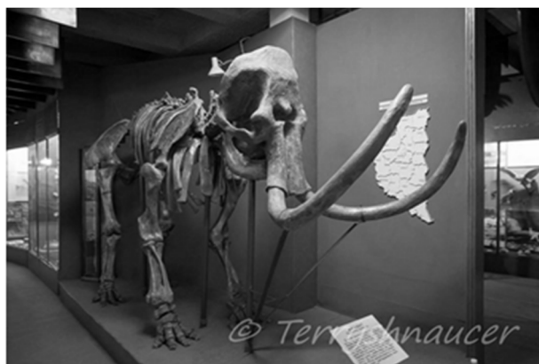
Рис. 2.2. Природничий відділ Тернопільського краєзнавчого музею[2].

Другий поверх музею відданий чисельній колекції природничих матеріалів (Див.: Рис. 2.2), які об'єднані у збірки «Палеонтологія», «Геологія і мінералогія», «Зоологія» та «Ботаніка». До найцікавіших із них належать унікальна колекція комах, чучела рідкісних тварин та птахів. Експозиції відділу природи побудовані здебільшого за допомогою діорам, що відтворюють основні ландшафти та природні особливості краю.