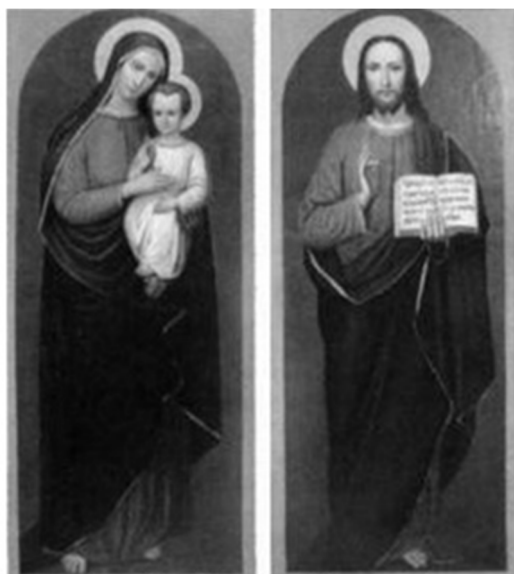
Рис. 2. 11. А. Шурма. Пресвята Богородиця. Ісус Христос. XX ст. [4].

Кращі риси італійського Відродження втілює картина "Муки святого". Привертають увагу ілюзорний натюрморт "Симфонія" (1753), досконалий "Портрет молодого чоловіка" (XVII ст.) невідомого автора. Французьку школу представляють два твори на міфологічні теми і класичний пейзаж середини XVIII ст. Про мистецтво Чехії дають уяву картини мистців кола П. Брандлі "Навчання рахунків" і "Портрет чоловіка з монетами".