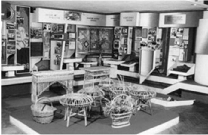
Рис. 2.4. Зал сучасного періоду. Народні промисли (лозоплетіння)[5].

В експозиції Шевченківського залу музею зокрема представлені матеріали про Єжи Єнджеєвича [3].