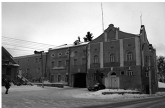
Рис. 2.3.Кременецький краєзнавчий музей[4].

Кременецький краєзнавчий музей – науковий культурно-освітній заклад у місті Кременець Тернопільської області (Див.: Рис. 2.3).