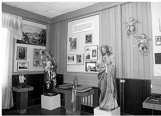
Рис. 2. 15. Унітарський період почаївсько мистецтва[2].

Почаївський історико-художній музей – науковий культурно-освітній заклад у місті Почаїв Тернопільської області. Почаївський історико-художній музей створений у 1959 р. з ініціативи Андріюка Андрія Васильовича як музей атеїзму. На той час він займав дві кімнати приміщення міського будинку культури. Створення музею припадає на пік розвитку атеїстичної пропаганди в краю. Згодом музей стає відділом Тернопільського обласного краєзнавчого музею і отримує нове приміщення безпосередньо під стінами Почаївської Успенської лаври.