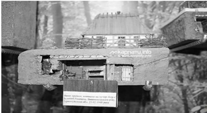
Рис. 2. 13.Макет криївки, яку було виявлено на хуторі біля с. Великий Раковець [8].

Окремий відділ музею присвячений репресованим духовним служителям греко-католицької церкви зі стендом, який розповідає про шлях Й. Сліпого. Експозиція відтворює режим утримання політичних в'язнів, одяг (Див. рис. 2.14), методи допитів, перебування ув'язнених у таборах.