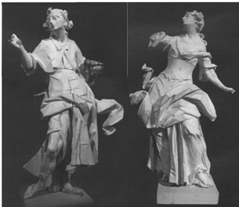
Рис. 2.10. І.Г. Пінзель «Товій» (зліва) та «Алегорія» (справа), XVIII ст.[4].

Зал 2. Зарубіжне мистецтво. Музейну експозицію продовжує західноєвропейська графіка, у свій час передана Ермітажем із Санкт-Петербурга. Розділ розпочинає офорт із циклу «Види Рима» італійського мистця XVIII ст. Д. Піранезі. Витончені психологічні зарисовки сучасників бачимо у літографіях француза П. Гаварні.