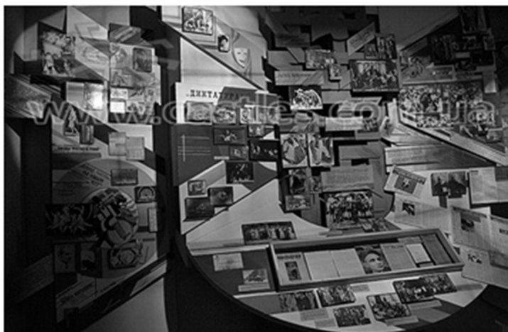
Рис. 2.8. Музей-садиба Леся Курбаса (експозиція «Творча діяльність у Києві») [4].

Меморіальний музей-садиба Леся Курбаса — державний музейний заклад у селі Старий Скалат Підволочиського району Тернопільської області. Відкритий у лютому 1987 до 100-річчя від дня народження Леся Курбаса. Від 1988 – відділ ТОКМ, від 2002 – у віданні Тернопільського обласного відділу культури. Експонати розповідають про життєвий і творчий шлях Леся Курбаса, вшанування його пам'яті, діяльність театрів товариства «Руська бесіда», «Тернопільські театральні вечори», «Молодого театру», театрів «Київського драмтеатру» (Див. рис. 2.8), «Березіль».