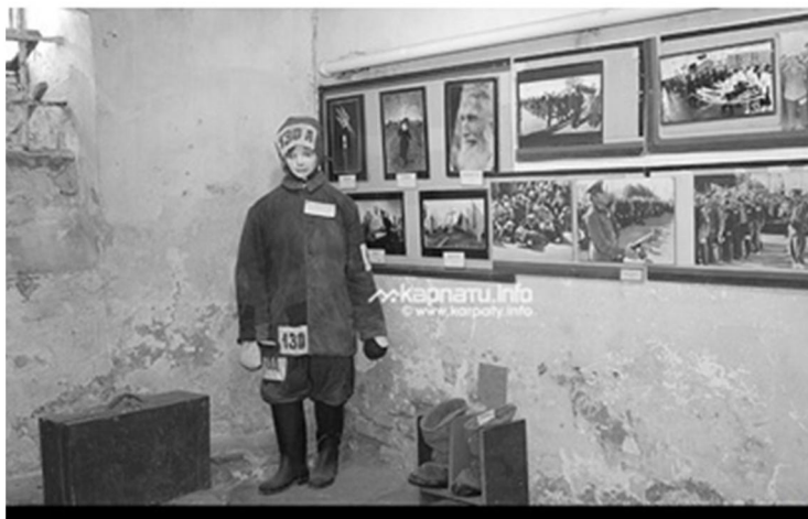
Рис. 2.14. Макет одягу політичних в'язнів[8].

Окремий відділ музею присвячений репресованим духовним служителям греко-католицької церкви зі стендом, який розповідає про шлях Й. Сліпого. Експозиція відтворює режим утримання політичних в'язнів, одяг (Див. рис. 2.14), методи допитів, перебування ув'язнених у таборах.