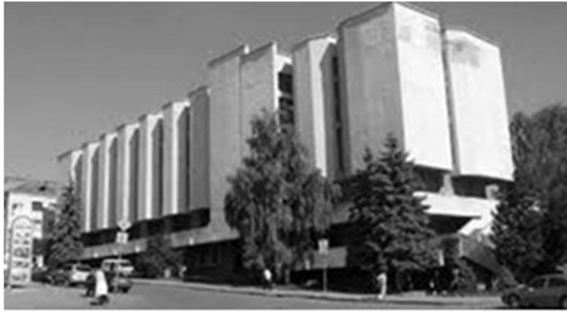
Рис. 2.1. Тернопільський краєзнавчий музей [2].

Тернопільський краєзнавчий музей – краєзнавчий музей у місті Тернополі, що має найбільше зібрання пам’яток і матеріалів з природи, історії, етнографії і побуту Тернопільщини, це найдавніший заклад культури і просвітництва в області (див.: Рис. 2.1).