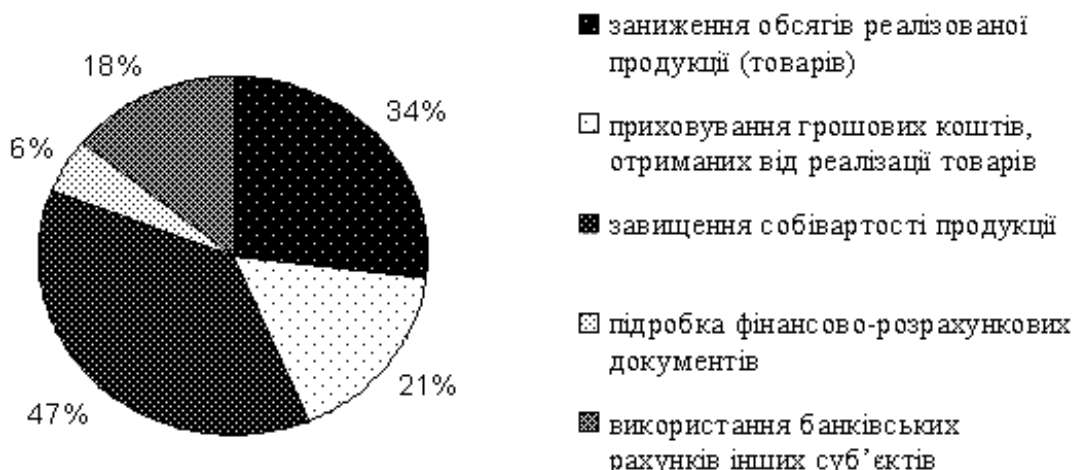
Рис. 1. Найбільш поширені способи ухилення від сплати податків

Таким чином, аналіз слідчої практики показує, що в Україні найбільш поширеними способами ухилення від сплати податків є: заниження обсягів реалізованої продукції (товарів) – 34%; приховування грошових коштів, отриманих від реалізації товарів – 21%; завищення собівартості продукції – 47%; підробка фінансово-розрахункових документів – 6%; використання банківських рахунків інших суб'єктів підприємництва – 18% (рис. 1) [9].