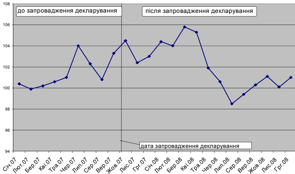
Рис. 1. Індекси зміни роздрібних цін на продукти харчування

Графіки динаміки індексів зміни роздрібних цін на продукти харчування та зміни цін виробників продуктів харчування, що представлені на рис. 1 та 2, відповідно, доводять правильність визначення часу запровадження даного методу регулювання. Саме у жовтні 2007 р. спостерігалися найбільші темпи зростання як роздрібних, так й оптових цін виробників продовольчої продукції (відповідні індекси становили 104,5%).