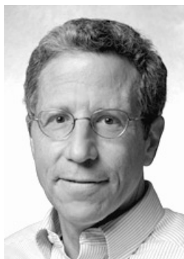
Ерік Мескін (Eric S. Maskin)