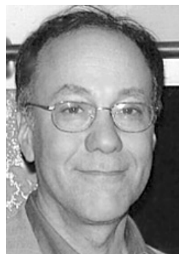
Роджер Майєрсон (Roger B. Myerson)