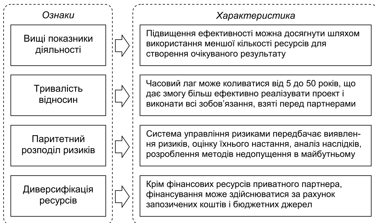
Рис. 3.9.1. Ознаки державно-приватного партнерства*