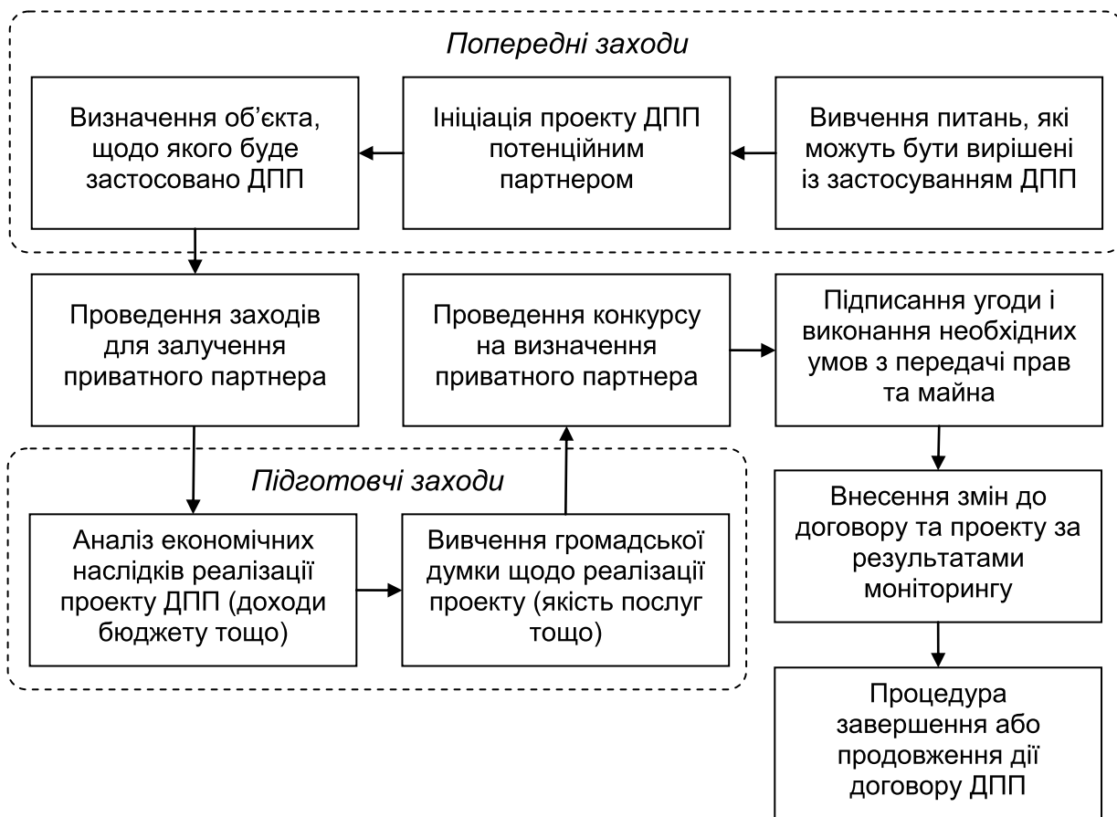
Рис. 3.9.4. Алгоритм реалізації проектів державно-приватного партнерства в Україні

Примітка. Побудовано на основі загальної схеми процесів (послідовності) реалізації проектів ДПП в Україні (див.: https://drive.google.com/file/d/0B5EMzR-8ftdOYVpUVINYNHZTc2c/view ).