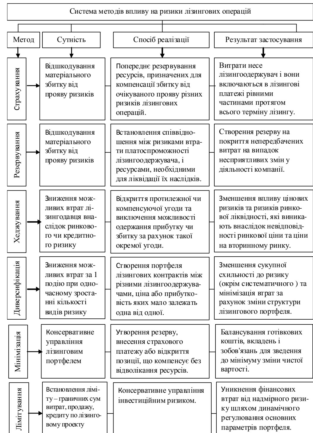
Рис. 1. Характеристика методів впливу на ризики лізингових операцій

Примітка. Побудовано авторами на основі опрацювання [11; 12].