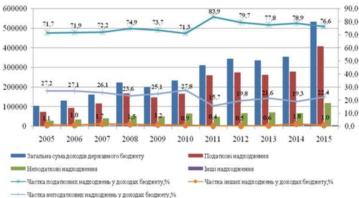
Рис. 1. Формування доходів держави з податкових, неподаткових та інших надходжень у 2005-2015 рр., млн. грн. *

Основу доходів ДБ становлять податкові надходження, частка яких у середньому за досліджуваний період дорівнювала 75,7%, що в 3,3 раза більше за питому вагу неподаткових платежів. Обсяги останніх зростають, коли спостерігається брак податкових відрахувань, що простежується на рис. 1.