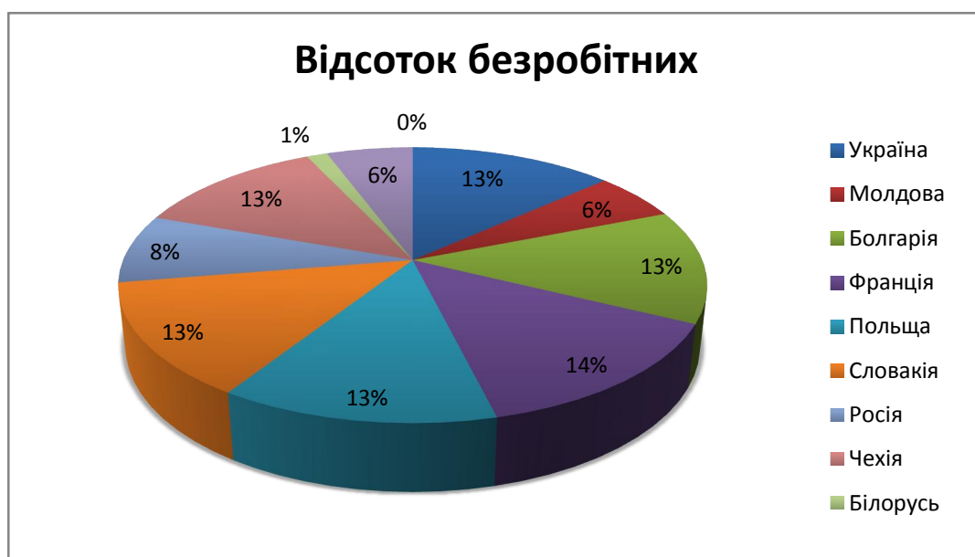
Рис.2.1 Рівень безробіття країн-сусідів у відсотковому співвідношенні