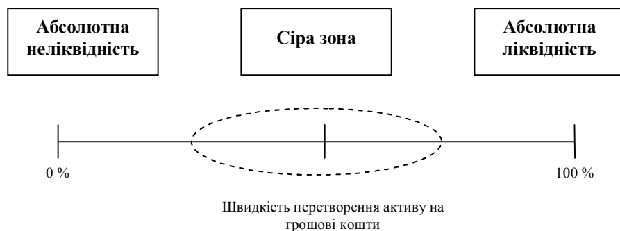
Рис. 1. “Парадокс ліквідності”, випадок одновимірної неоднозначності

Науковці Р. Кардозо і А. Бусанеллі де Аквіно [1] в контексті дослідження ліквідності виділяють одновимірну і багатовимірну неоднозначність класифікації активів на основі наявності єдиного чи кількох критеріїв відповідно. Зосереджуючись на одновимірній неоднозначності, вчені пропонують розрізнити неліквідну, ліквідну і сіру зони лівої частини Балансу (рис. 1). Такий поділ є досить спрощеним, однак корисним для глибшого розуміння суті піднятої проблеми.