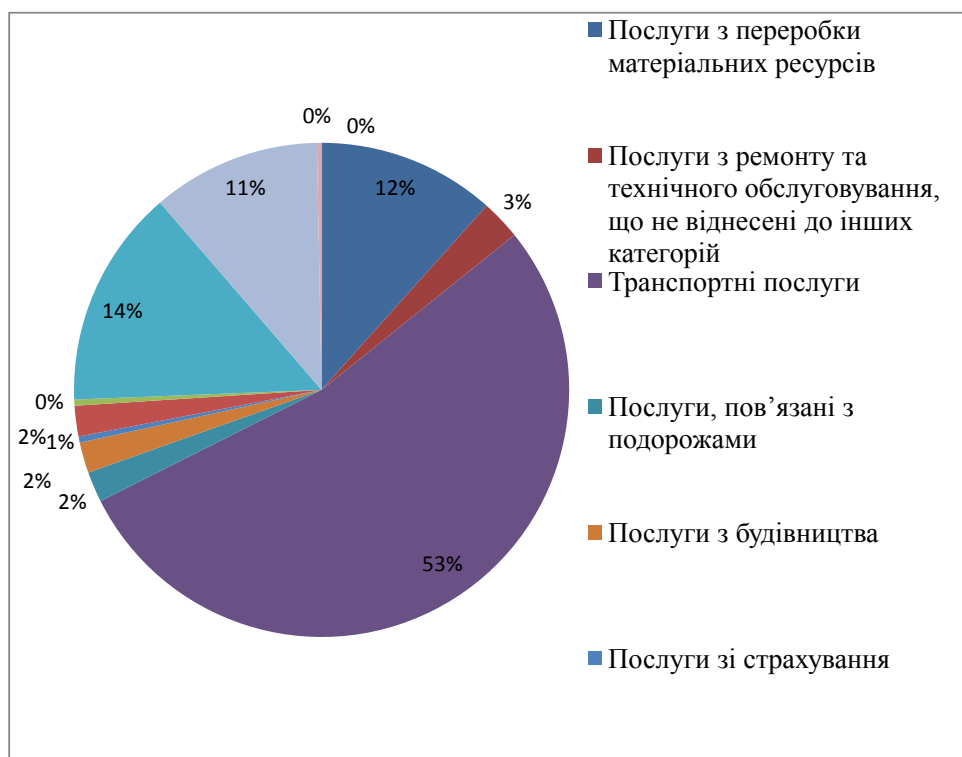
Рис. 3.3. Структура зовнішньої торгівлі послугами України за 2014 р.*

порівняно з 2011 р. збільшився, а зовнішньоторговельні операції проводились з партнерами із багатьма країнами світу. Традиційно найбільшим торговельним партнером, як в імпорті так і експорті послуг серед країн світу в нашої держави є Російська Федерація, і показники експорту товарів в даній тенденції не є виключенням. Варто зазначити, що обсяги експорту товарів та послуг є вагомим критерієм існування будь-якої економіки світу, адже дають змогу ззовні залучити грошову масу, яка допомагає розвиватися галузям національного господарства.