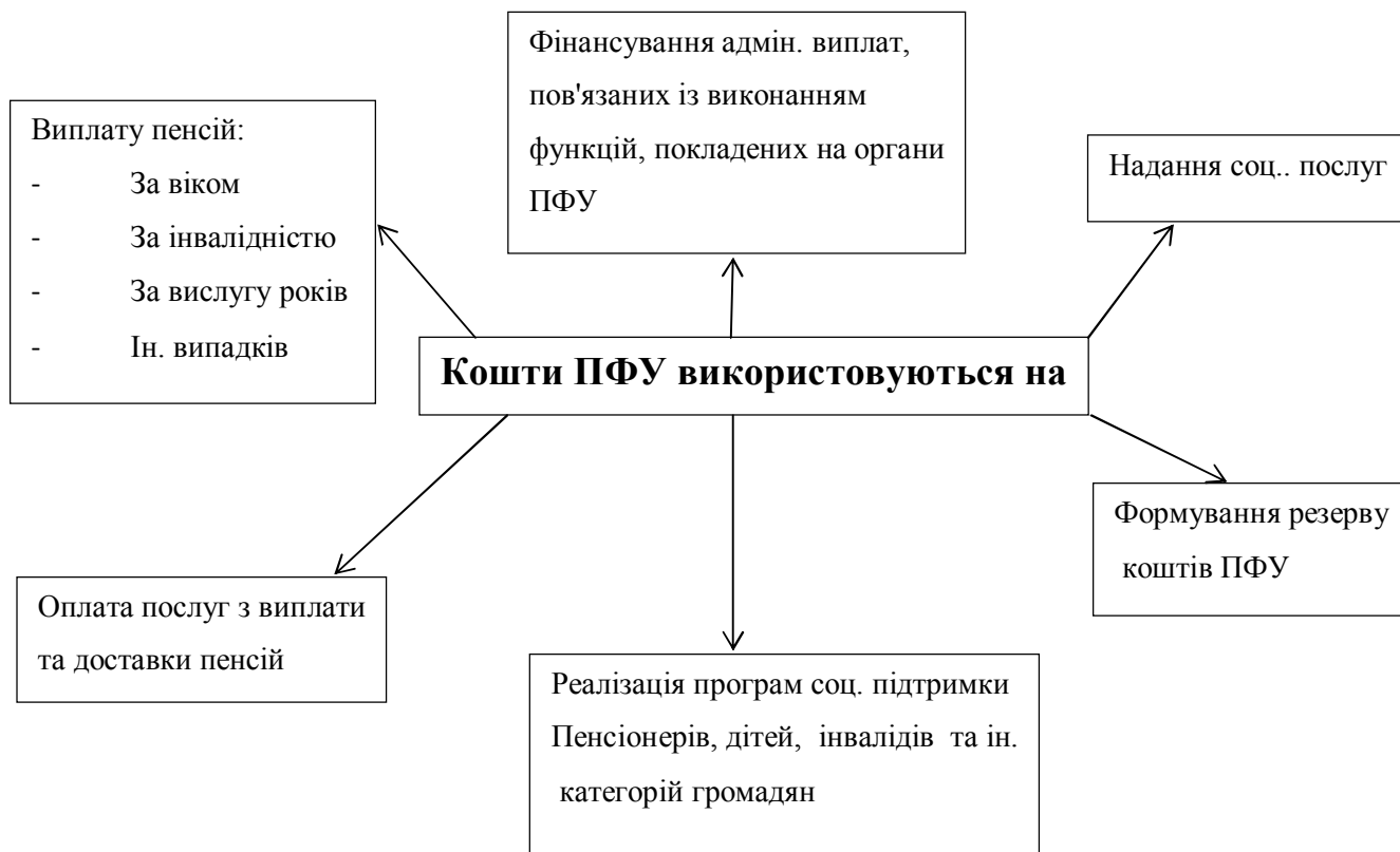
Рис. 1.1. Напрями використання коштів ПФУ [3]

Щодо використання ресурсів Пенсійного фонду, то умовно їх можна поділити на шість напрямів (Рис. 1.1.).