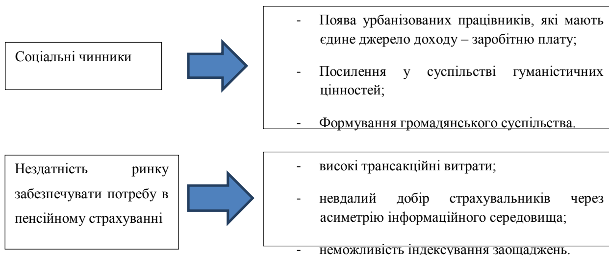
Рис. 1.2. Чинники, які зумовлюють необхідність існування інституту державно пенсійного страхування [1]

Пенсії, соціальні виплати та допомоги мають забезпечувати рівень життя, не нижчий від встановленого законом прожиткового мінімуму.