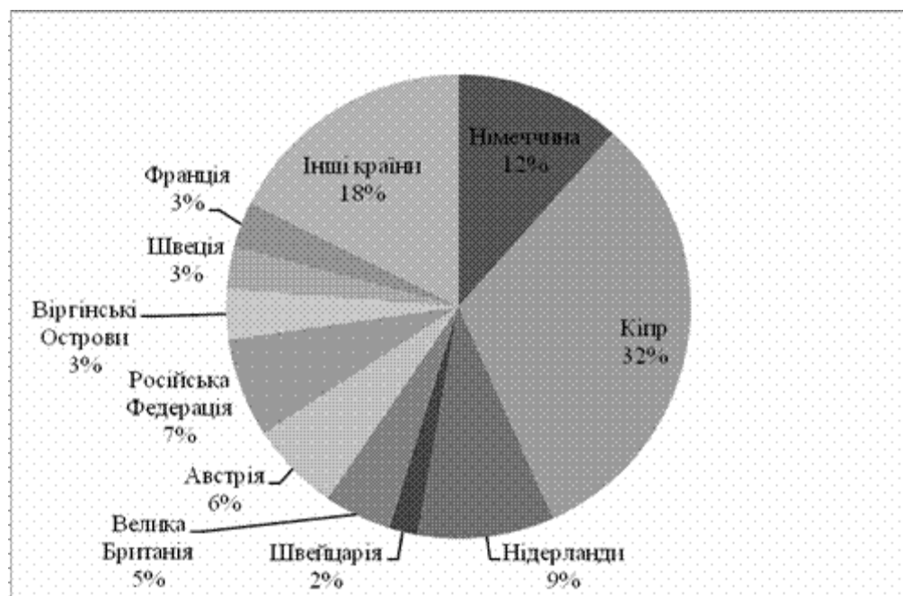
Рис. 2.3. Розподіл прямих іноземних інвестицій в Україну за країнами-інвесторами, %

Основні потоки іноземних інвестицій у 2012 році були направлені із таких країн: Кіпр – 17275,1 млн. дол. США, Німеччина – 6317,0 млн. дол. США, Нідерланди – 5168,6 млн. дол. США, Російська Федерація – 3785,8 млн. дол. США, Австрія – 3401,4 млн. дол. США, Велика Британія – 2556,5 млн. дол. США, Віргінські Острови – 1884,9 млн. дол. США, Франція – 1765,3 млн. дол. США, Швеція – 1600,1 млн. дол. США та Швейцарія – 1106,2 млн. дол. США (рис. 2.3)[15].