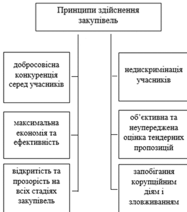
Рис. 3.1 Засадничі принципи організації закупівель*

квітня 2016 року для замовників-центральної влади та підприємств з окремих сфер господарської діяльності та з 1 серпня 2016 року для всіх інших замовників. Отже, з цієї дати всі надпорогові закупівлі (тобто ті, вартість яких дорівнює або є більшою за вартість, що встановлена в абз. 2 та 3 ч. 1 ст. 2 Закону № 922; для послуг – 200 тисяч гривень, робіт – 1,5 мільйона гривень) мають здійснюватись через електронну систему закупівель. Порядок проведення надпорогових закупівель регламентується Законом № 922. Станом на 2016 рік було здійснено 366 тисяч закупівель на загальну суму у 274 млрд. гривень. З них 101 тисяча закупівель були надпороговими (22 тисячі проходили через «ProZorro»), 136 - допороговими, а ще по 128 тисячах у електронну систему були завантажені звіти. Загальна економія бюджетних коштів склала близько 10 млрд гривень. На Рис. 3.1 представлено засадничі принципи державних закупівель, що дають змогу досягнути прозорості та доброчесності.