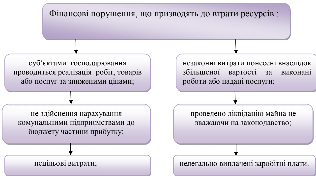
Рис. 3.1 Фінансові порушення, що призводять до втрати ресурсів