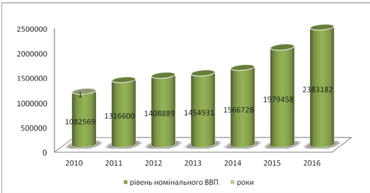
Рис.2.2 Динаміка номінального ВВП упродовж 2010-2016 рр.

Як видно, рівень номінального ВВП щорічно зростає. Показник ВВП є важливим індикатором стану національної економіки, що віддзеркалює рівень її розвитку. Темп зростання реального ВВП є впливовим чинником на зміну динаміки доходів як державного, так і місцевих бюджетів, всі показники яких об'єднує Зведений бюджет України, що використовуються для аналізу та прогнозування економічного і соціального розвитку держави (ст. 5, 6 Бюджетного кодексу України). Втім збалансування номінальних показників бюджетів держави відбувалося передусім за рахунок зростання рівня інфляції, що може сприяти приросту загального обсягу податкових надходжень лише у короткостроковій перспективі, оскільки сплата додаткових податкових платежів («інфляційного податку»), як правило, призводить не тільки до одночасного суттєвого зниження доходів і добробуту їх платників, а отже й рівня платоспроможного попиту, але й до вичерпування джерел подальших бюджетних надходжень.