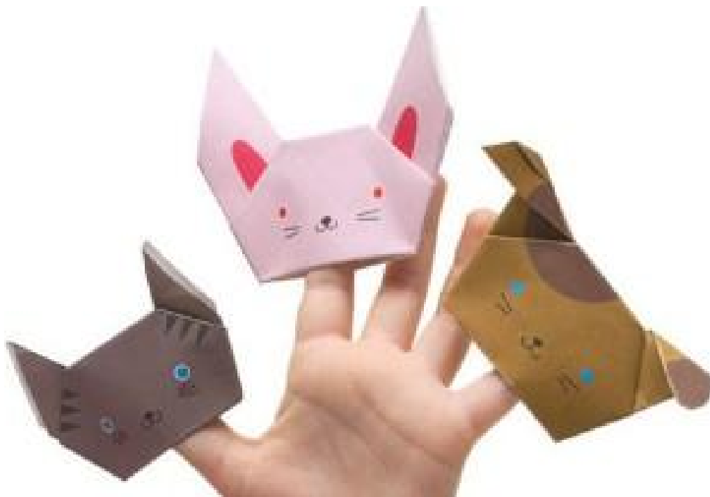
Схема виготовлення пальчикової ляльки з паперу

А. Виготовлення голівок тварин із паперу.