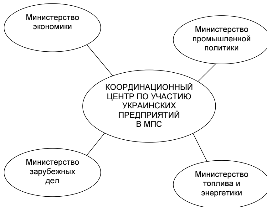
Схема синхронизации и координации профильных министерств