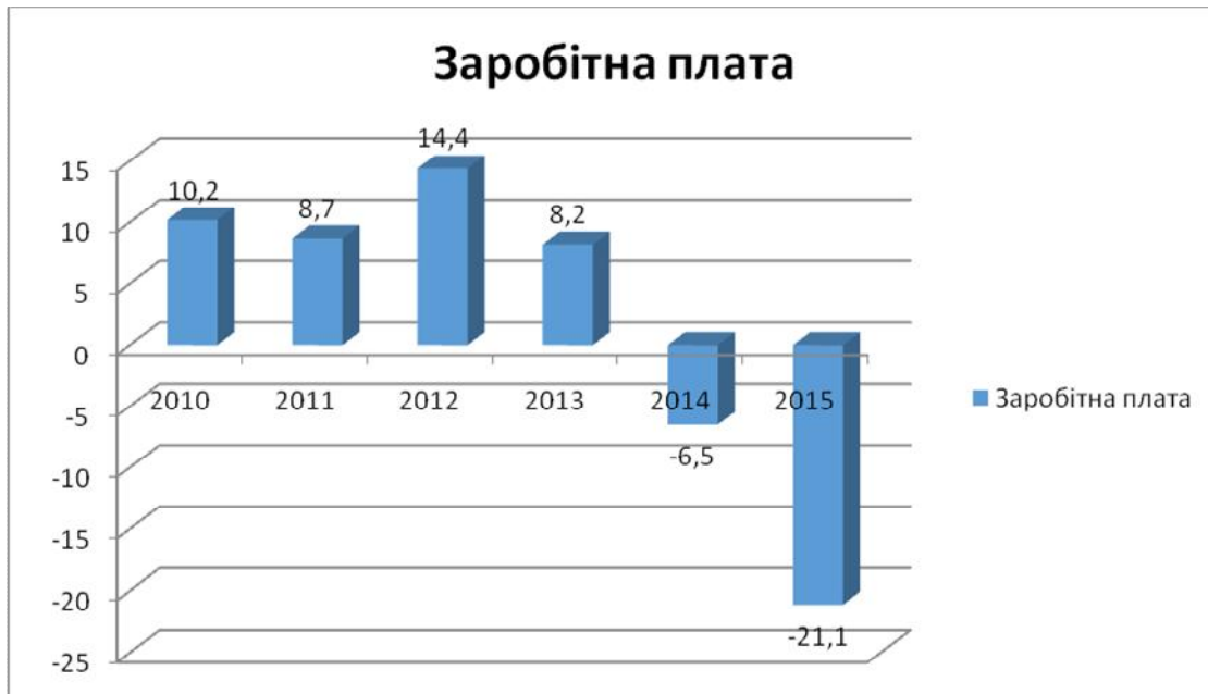
Рис. 1. Динаміка середньомісячної реальної заробітної плати в 2010-2015 рр. у відсотках до попереднього року [6].

розраховувати свої фінанси. Але якщо мова йде про сім'ю, про пенсіонерів чи інвалідів заробітна плата ставить найменш захищене населення в жорсткі умови.