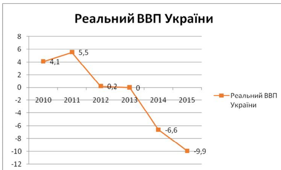
Рис. 3. Реальний ВВП України, зміни у процентах до попереднього року, 2010-2015 рр. [6].

Спостерігаючи за динамікою зміни рівня ВВП в 2013 р. Було зафіксоване нульове зростання реального ВВП, але в 2014 р. воно змінилось скороченням на 6,6%. Це було спричинено конфліктом на сході нашої країни, а також падінням цін на сировину на глобальному ринку.