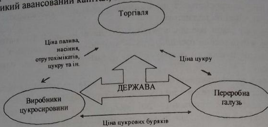
Рис. 3. Запропонована модель еквівалентності обміну між всіма партнерами інтегрованого бурякоцукрового виробництва

торгівлею через формування в кожній галузі цін на продукцію на базі концепції ціни виробництва, що забезпечує отримання рівновеликого прибутку на рівновеликий авансований капітал, включаючи вартість землі.