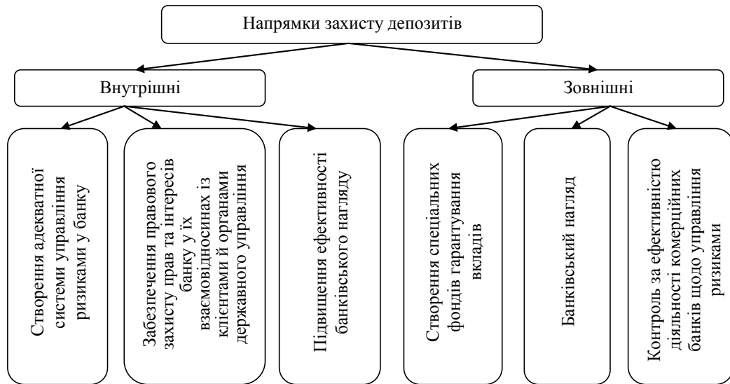
Рис. 3. Напрямки захисту депозитів*