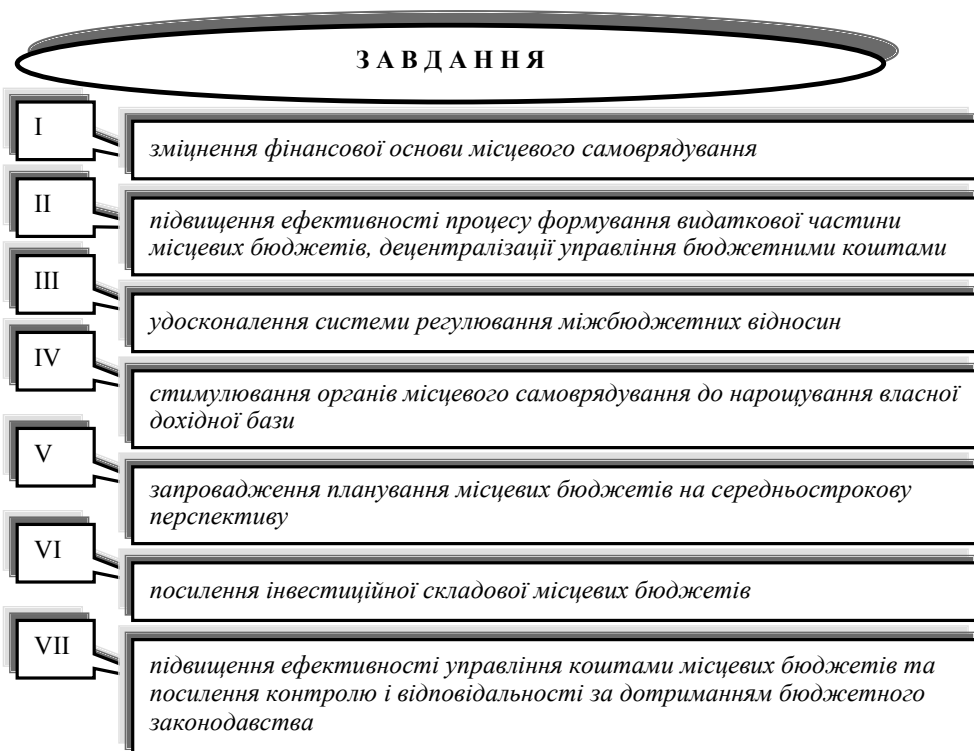
Рис. 2. Завдання Концепції реформування місцевих бюджетів

місцевими бюджетами; розроблення методики визначення стандартів надання основних соціальних послуг населенню та їх вартості; відпрацювання теоретико-методологічних засад програмно-цільового методу планування видатків місцевих бюджетів і запровадження планування місцевих бюджетів на середньострокову перспективу; удосконалення нормативного регулювання правовідносин, пов'язаних зі здійсненням запозичень до місцевих бюджетів; надання методичної та консультативної допомоги органам місцевого самоврядування для підвищення ефективності і якості управління коштами місцевих бюджетів та проведення їх реформи [5].