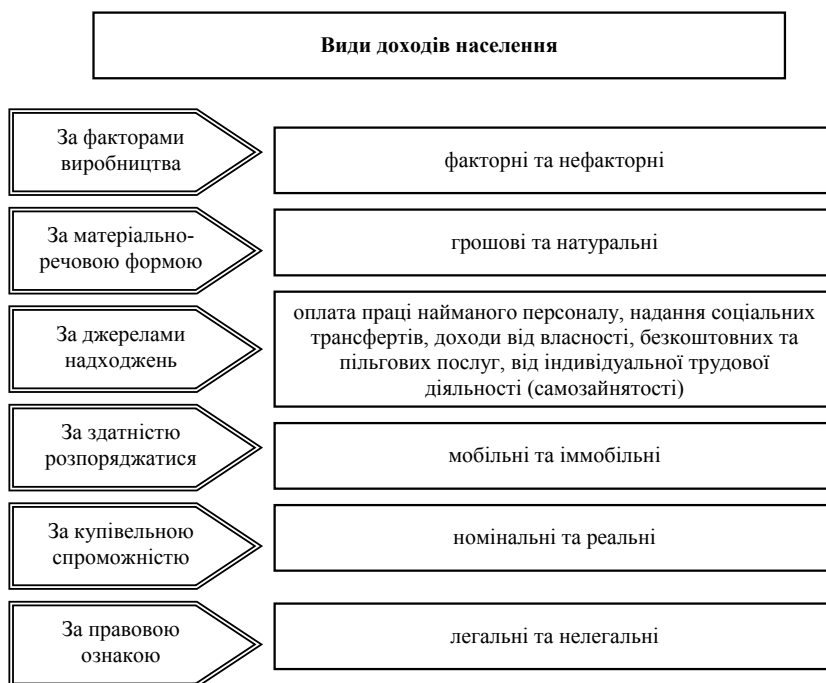
Рис. 1. Класифікація доходів населення

лення України є найменшою (4%). Такий стан речей, на наш погляд, пов'язаний перш за все з міграцією сільського населення у міста.