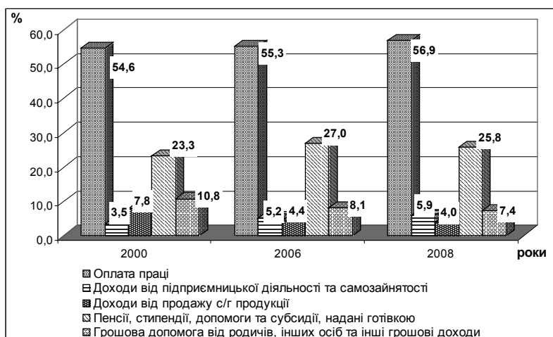
Рис. 2. Структура грошових доходів населення України

Під натуральними доходами розуміють надходження натурою від підприємств, держави, а також умовні нарахування від проживання у власному помешканні. До таких доходів також відносять усі надходження продуктів