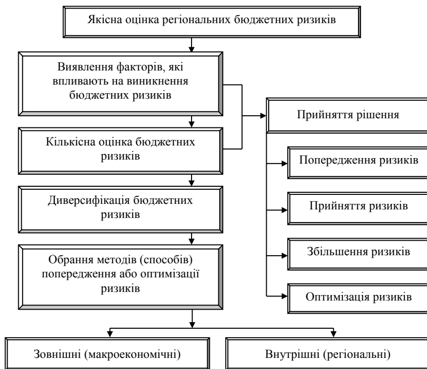
Рис. 2. Система управління регіональними бюджетними ризиками

За даними табл. 1 видно, що у 2009 р. спостерігалось невиконання розрахункових показників бюджетних доходів як за власними, так і за закріпленими надходження-