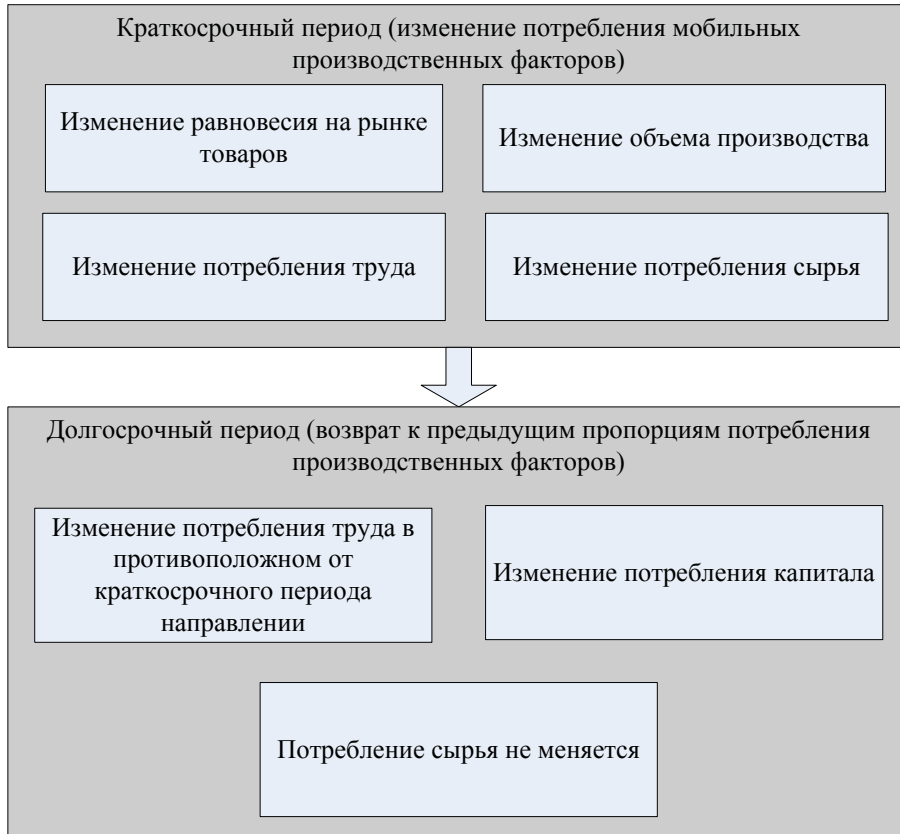
Рис. 2. Направления изменения потребления производственных факторов после налоговой реформы

После оценки, с помощью основных тенденций на рынке товаров, труда и капитала, могут быть определены воздействия налоговых реформ на различные сферы экономики, что является аналитической почвой для разработки рекомендаций относительно совершенствования политики в сфере налогообложения.