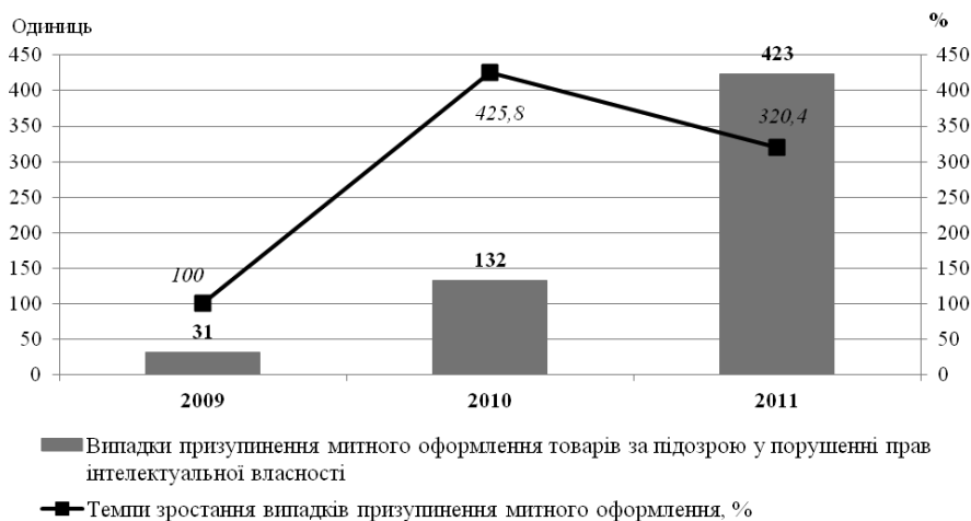
Рис 3. Динаміка призупинення митного оформлення товарів за підозрою у порушенні прав інтелектуальної власності у 2009–2011 рр.*

У результаті проведеної роботи у напрямку боротьби з контрабандою та пору-