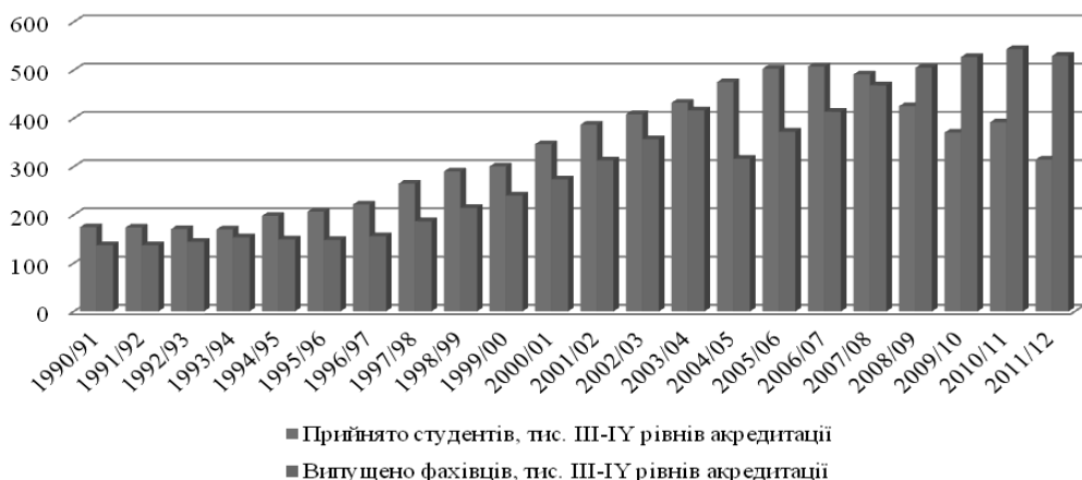
Рис. 4. Кількість прийнятих студентів та випущених фахівців вищих навчальних закладів III-IV рівнів акредитації за 1991–2011 рр.*