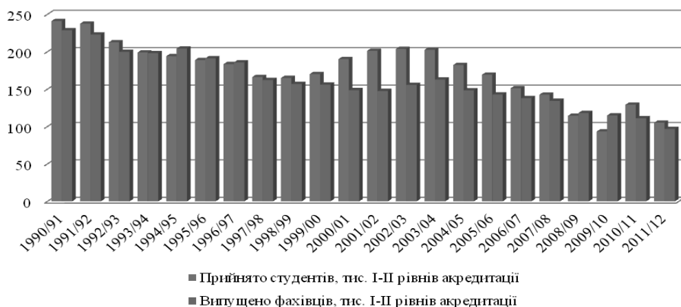
Рис. 3. Кількість прийнятих студентів та випущених фахівців вищих навчальних закладів I–II рівнів акредитації за 1991–2011 р.*

зменшення чисельності випускників середніх шкіл на 5 тис. у зв'язку з цим скоротилась і кількість студентів, в основному, на вечірній та заочній формі навчання. Можна спрогнозувати, що скорочення кількості випускників середніх шкіл буде щорічно складати 10% протягом найближчих 5 років (лише з 2020 р. кількість випускників шкіл почне зростати щорічно на 2%). Демографічна криза не може не відобразитися на структурі вищої школи в цілому і на підвищенні ступеня конкурентоспроможності вищих навчальних закладів.