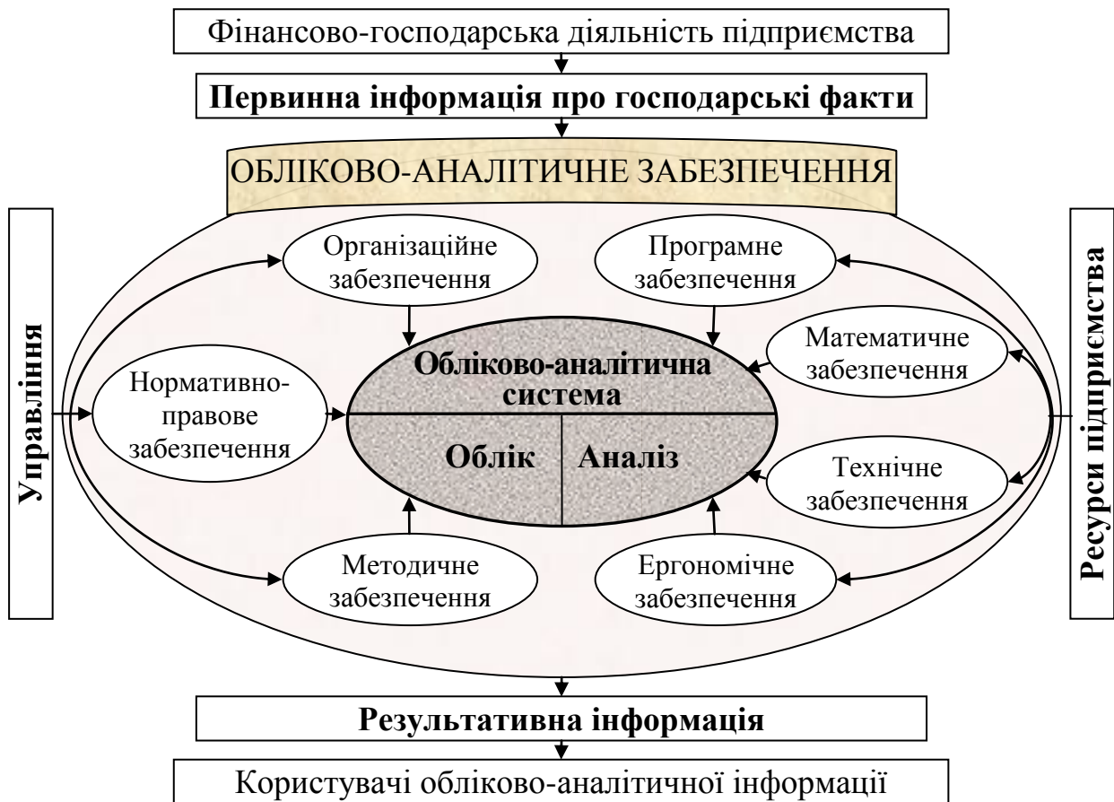
Рис. 1. Система обліково-аналітичного забезпечення управління підприємством

В роботі доведено, що створення ефективної обліково-аналітичної системи на підприємстві слід починати з формулювання ключових завдань використання інформації, чіткого визначення інформаційних потреб управління, що відображають індивідуальні особливості підприємства, конкурентну ситуацію і стратегію. Обліково-аналітична інформація призначена для зацікавлених користувачів, а отже, має виконувати їхні поточні й майбутні запити. Для забезпечення зазначених вимог встановлені зовнішні та внутрішні споживачі інформаційних даних спиртового підприємства, які об'єднано в групи, що відображають п'ять рівнів управлінської ієрархії: оперативний, середній і вищий рівні менеджменту, банки та контрагенти, установи державного регулювання й контролю. Це дало змогу визначити вимоги кожної групи до складу, повноти, оперативності й форми подання інформації.