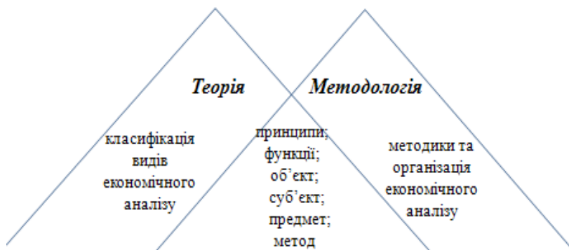
Рис. 2. Структурні елементи теорії та методології економічного аналізу

Структурними елементами (компонентами) методології економічного аналізу є: функції, принципи, предмет, об'єкт, суб'єкт, метод. Ці елементи з повним правом можна віднести і до теорії економічного аналізу, оскільки методологія – це теорія в дії. Таким чином, у спільній для теорії і методології економічного аналізу площині, знаходяться функції, принципи, предмет, об'єкти, суб'єкт і метод (рис. 2). Класифікація видів – це прерогатива теорії економічного аналізу, а методики та організація – сфера його методології. Відповідно, зміна парадигми потребує уточнення та доповнення структурних елементів теорії і методології економічного аналізу у контексті їх відповідності сучасним реаліям господарювання.