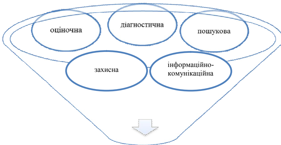
Рис. 3. Функції економічного аналізу у контексті зміни його парадигми

рішень на різних рівнях управління – економічний аналіз вирішує шляхом реалізації ряду функцій. Функції економічного аналізу визначаються його сутністю і цілями. Сучасний розвиток економічних відносин і умов господарювання обумовлює необхідність розширення функцій економічного аналізу, виконання яких забезпечує реалізацію поставлених цілей і завдань. З огляду на це, такі, виокремлені більшістю науковців, основні функції економічного аналізу, як оціночна, діагностична та пошукова, на нашу думку, доцільно доповнити захисною, інформаційно-комунікаційною та контрольною (рис. 3).