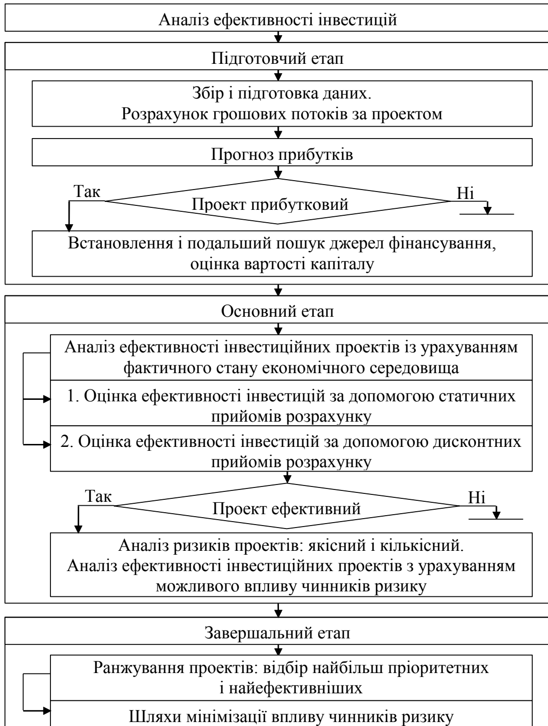
Рис. 2. Деталізована схема проведення аналізу ефективності інвестиційних проектів для підприємств молочної промисловості

Для кількісної оцінки ризику у молочній промисловості запропоновано використовувати імітаційне моделювання, що забезпечує велику аналітичну можливість кінцевих результатів, найбільше підходить в умовах невизначеності стосовно цін на сировину, готову продукцію, щодо попиту на певні молокопродукти в умовах нестабільної економічної ситуації, дозволяє скоротити витрати праці і часу.