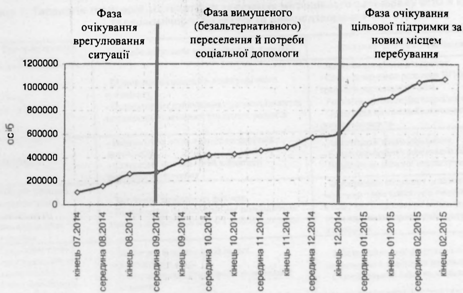
Рис. 1. Динаміка реєстрації ВПО в Україні, липень 2014 року — лютий 2015 року, осіб