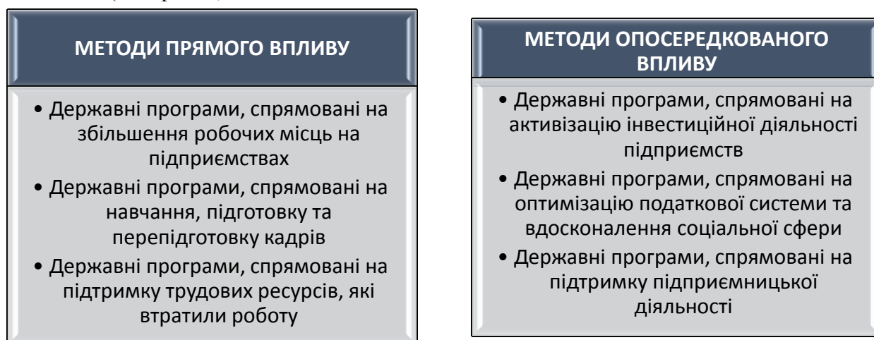
Рис. 2. Методи державного регулювання трудових ресурсів.

Політика держави в регулюванні ринку праці спрямована на стимулювання структурної перебудови і перерозподілу працівників, що вивільнюються, залучення безробітних у сферу виробництва, допомога у працевлаштуванні. Для цього застосовуються такі методи (див. рис. 2):