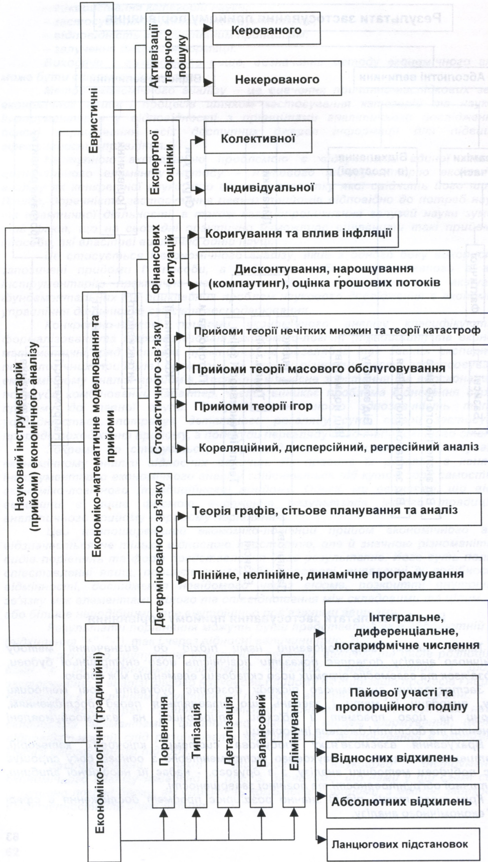
Рис.3. Типологія прийомів економічного аналізу