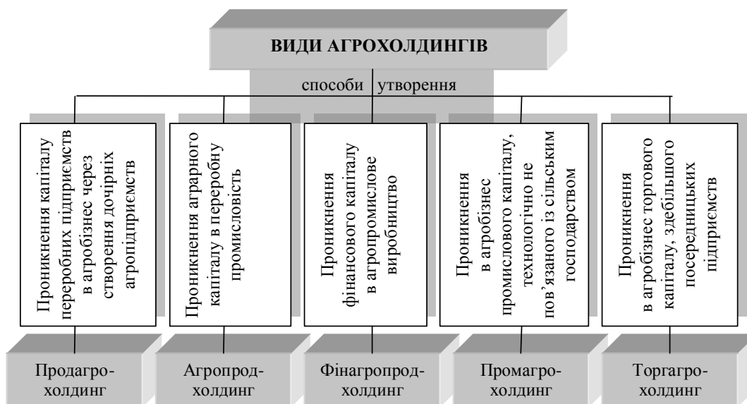
Рис. 1. Способи утворення різних видів агрохолдингів відповідно до наявності домінуючого інтегратора

Аграрні холдинги, за твердженням В. Г. Андрійчука, "...є результатом капіталізації та економічної концентрації, а їхньою особливою рисою є спосіб організації управління на основі виділення головної великої компанії і втрати права юридичної особи усіма іншими підприємствами, що увійшли до її складу, з подальшим їхнім перетворенням у структурні підрозділи" [4, с. 47]. І хоча вчений визнає термін "агрохолдинг" умовним, все ж пропонує відображати домінують інтегратора такого утворення, відповідно до чого подає такі різновиди агрохолдингів (рис. 1).