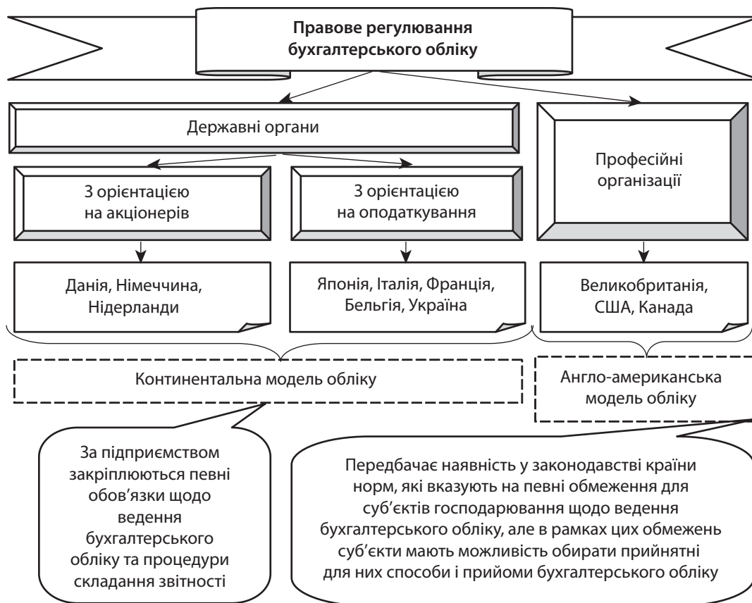
Рис. 1. Підходи до правового регулювання бухгалтерського обліку

Для виявлення інших можливих шляхів удосконалення вітчизняної системи регулювання бухгалтерського обліку порівняємо її з досвідом інших країн (табл. 2).