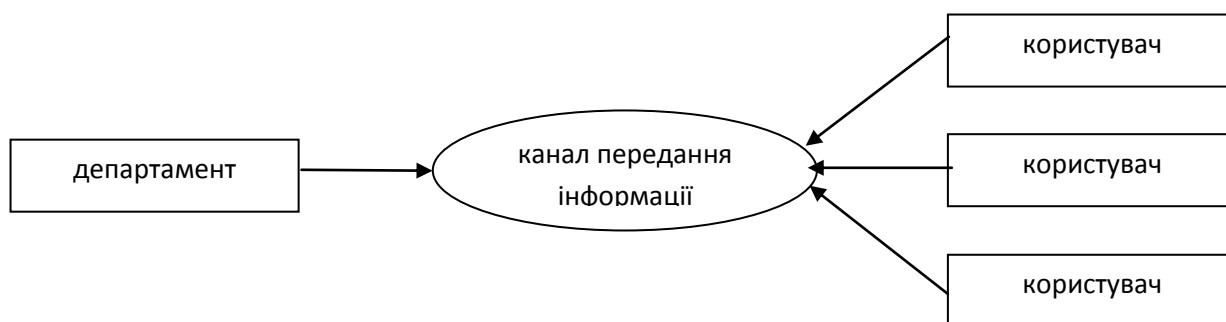
Рис. 3.4. Модель комунікації, в якій інформація надається у відповідь на інформаційний запит користувача

полягає у необхідності докладання значних зусиль для залучення користувачів, та потребує від них більш пильної уваги до потреб та запитів користувачів, до нових підходів та сучасних технологій.