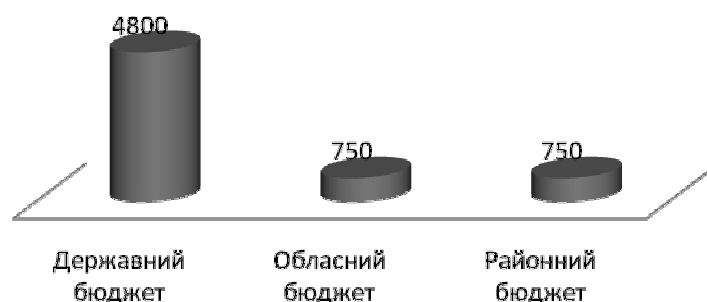
Рис. 1. Обсяги фінансування програми індивідуального житлового будівництва на селі «Власний дім» на 2016 р., тис. грн.

Дана програма буде виконуватись у декілька етапів, зокрема у 2016 р. заплановано 6300 тис. грн. ресурсного забезпечення. Обсяги фінансування здійснюються з різних бюджетів (рис. 1).