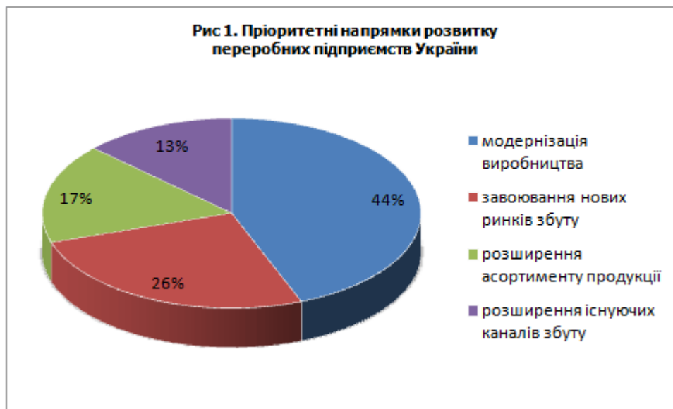
Рис. 2.1. Пріоритетні напрямки розвитку переробних підприємств України. [44]

підприємств. Результати опитування вказали, що більше трьох четвертих респондентів вважають, що переробні підприємства мають залучати інвестиції у розвиток виробництва. Структура пріоритетних напрямків розвитку підприємств подана на рис. 2.1.