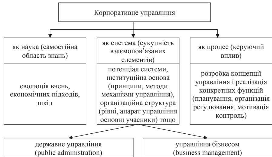
Рис. 2. Основні підходи до визначення поняття «корпоративне управління»

того, управління можна розглядати з різних точок зору. Так, одні учені та фахівці трактують поняття корпоративного управління крізь призму найхарактерніших рис, властивих тій