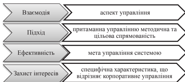
Рис. 3. Найважливіші компоненти корпоративного управління

На думку автора, визначення корпоративного управління повинно містити чотири найважливіших компоненти, які представлені на рисунку 3.