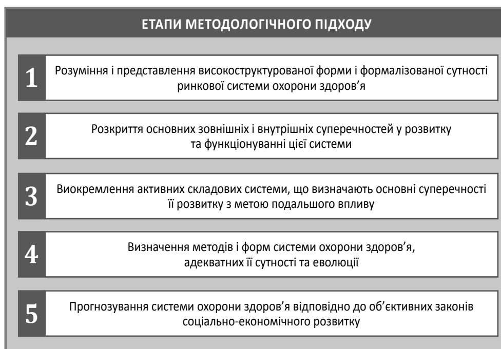
Рис. 2. Еволюція розвитку системи охорони здоров'я

Окремі дослідники 10 висловлюють припущення, що в рамках класичного системного аналізу є об'єктивні обмеження стосовно одночасного визначення внутрішніх і зовнішніх цілей системи, що функціонує в умовах кризи. Вирішення цієї проблеми видається реальним за умови розгляду методології дослідження системи охорони здоров'я в діалектичній єдності з адекватними формами і методами регулювання розвитку цієї системи. Тобто, з одного боку, сутність системи охорони здоров'я передбачає вибір та застосування адекватних методів і форм її регулювання, а з другого — практичні механізми активної підтримки функціонування цієї системи визначають необхідне її розуміння та представлення.