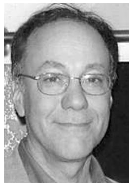
Роджер Майєрсон (Roger B. Myerson)