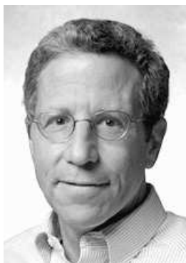
Ерік Мескін (Eric S. Maskin)