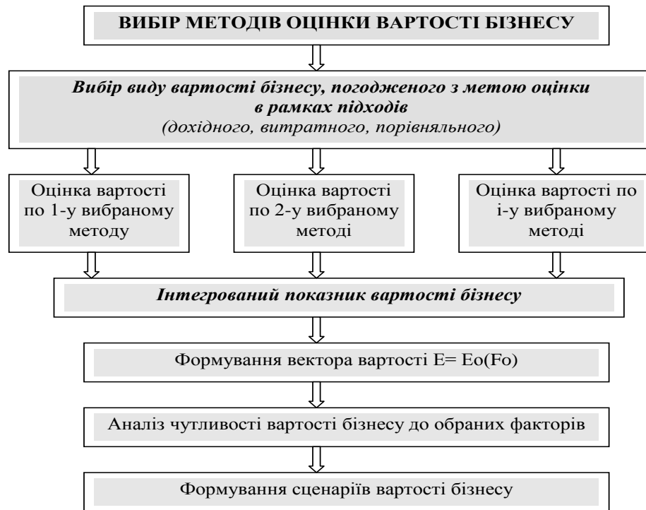
Рис. 1. Принципова схема формування оцінки вартості бізнесу: ( E – вартість капіталу; E_o – функція оцінки вартості; F_o – вектор факторів вартості) [2]

Таким чином, запропоновані етапи оцінювання вартості бізнесу охоплюють всі стадії життєдіяльності підприємства від моменту визначення завдання до отримання результатів дослідження у формі надання звітної документації. Зазначені етапи дослідження вартості суб'єкта господарювання дають змогу не тільки підтримувати стабільну його життєдіяльність, а й вірно сформувати логічну програму стратегічного розвитку бізнесу.