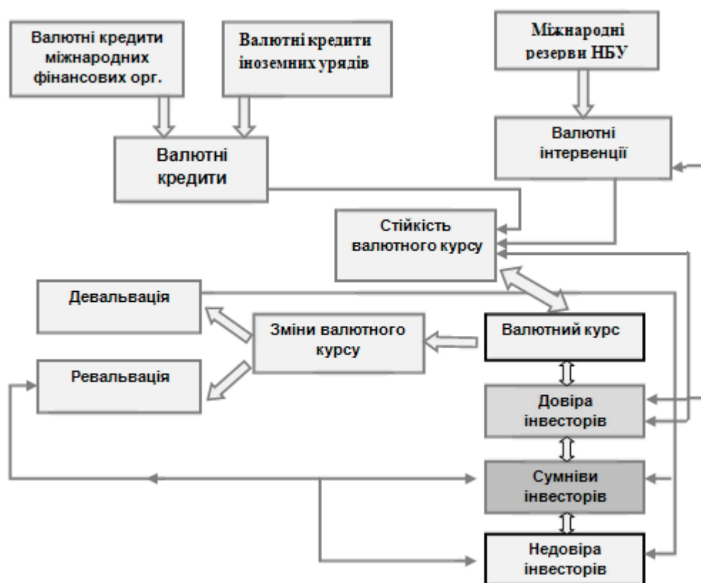
Рис. 2. Формування довіри на валютному ринку

коли регулятор не може забезпечити стабільність і здійснює девальвацію або ревальвацію грошової одиниці. Відповідно сумніви переходять у стан недовіри. Із суттєвим зменшенням резервів (але задовго до повного їх вичерпання) відбувається спекулятивна атака, що поглинає залишок резервів. Недовіра набирає таких розмірів, що розпочинається психоз з лавиноподібним поглибленням кризи. Кожен поспішає скористатися своїми депозитами чи іншими заощадженими коштами, перевести їх у твердоконвертовану (надійнішу) валюту з тим, щоб не допустити повного знецінення своїх заощаджень у національній валюті.